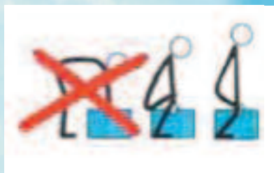
Comment soulever une charge

Le médecin du travail vous conseille sur le meilleur équilibre entre geste-posture-activité.