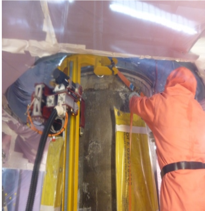
Rail vertical avec machine de découpe